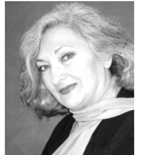
ویدا قهرمانی هنرپیشه پر قدرت سینما و تآثر

در خاتمه لازمست که تذکر داده شود بنیاد ریسمان طلائی «گلدن ترد» یک بنیاد غیرانتفاعی است که با کمکهای مؤسسات و اشخاص مسئول و با فرهنگ، به کارهای نمایشی و فعالیتهای خود ادامه میدهد و کمکهای نقدی افراد مشمول بخشودگی مالیاتی است.